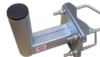
KNS142 + 2x Z85DV85